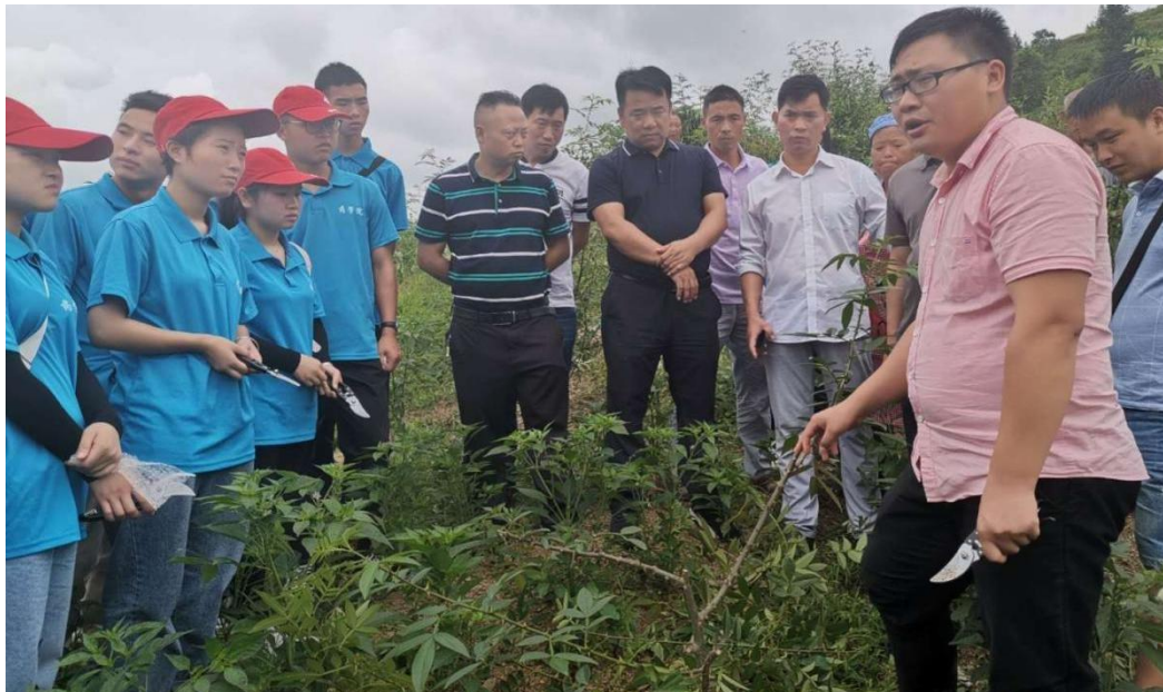
解决中药材种植关键技术，服务地方产业发展