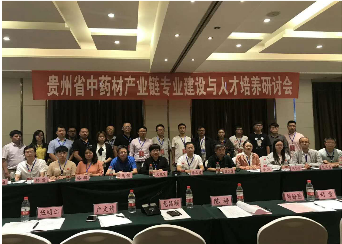
牵头举办贵州省中药材和石斛产业链专业建设与人才培养研讨会