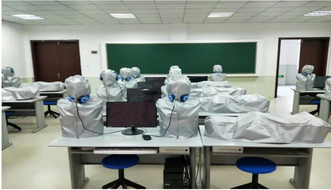
(多功能心肺腹触诊听诊系统)